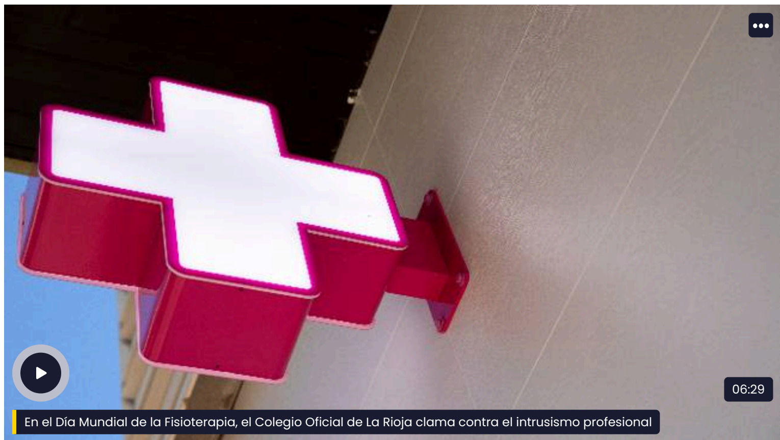
En el Día Mundial de la Fisioterapia, el Colegio Oficial de La Rioja clama contra el intrusismo profesional

Con motivo del Día Mundial de la Fisioterapia, el Colegio Oficial de La Rioja clama contra el intrusismo profesional