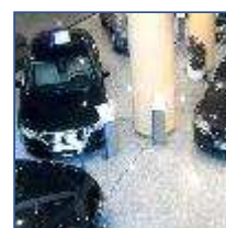
Las ve coches 29% er según