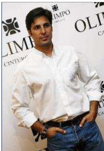
"mayor enemigo de los toros". >