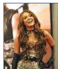
Miley C influen