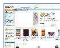
Amazo un sen de pag