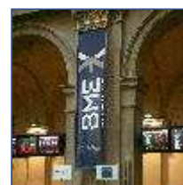
BME g millon septier